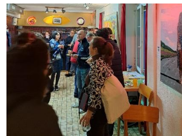
Tag der ZürcherInnen