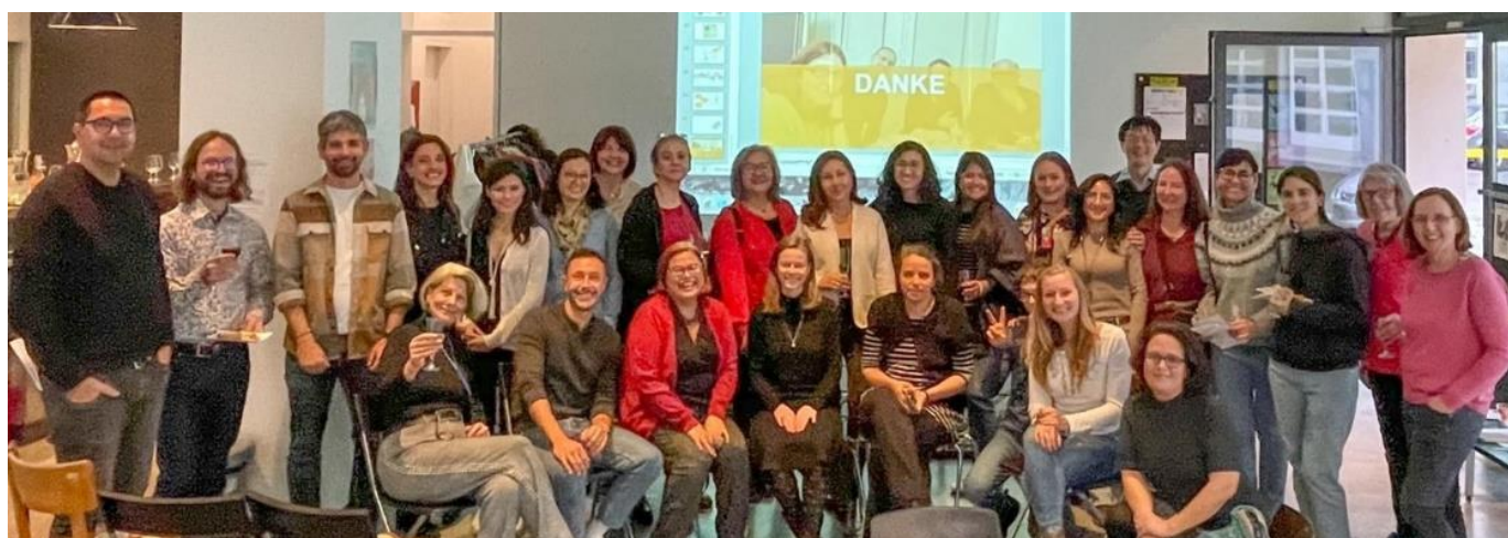
Asamblea General 2023

Nuestro trabajo es valorado y seguimos en camino creciendo y aprendiendo. Este año fue especial, a lo largo de las reuniones de planeación, a lo largo de los eventos y en las sesiones de evaluación, nos acompañó siempre la consciencia de la relevancia de las personas, del valor intrínseco y único de cada una de ellas, de lo que aportan. ETKultur tiene y hace magia, somos una plataforma de arranque, somos una red de apoyo social, somos un espacio de aprendizaje y creatividad, somos una comunidad. Hay demasiado amor y demasiada pasión envueltas en lo que hacemos, a veces no nos damos cuenta, pero, tras lograr nuestros objetivos y mirar para atrás, nos llenamos de satisfacción y de orgullo. Sabemos que vamos bien y, en este décimo año de compromiso social, podemos afirmar que ETKultur tiene un lugar que es respetado y reconocido en nuestra ciudad y nuestro cantón. Esto es el fruto del trabajo, del talento y del compromiso de muchas personas. Muchas gracias!