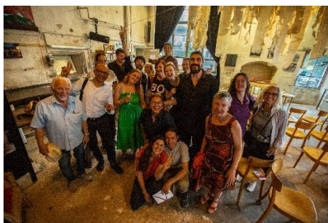
About Us Affoltern